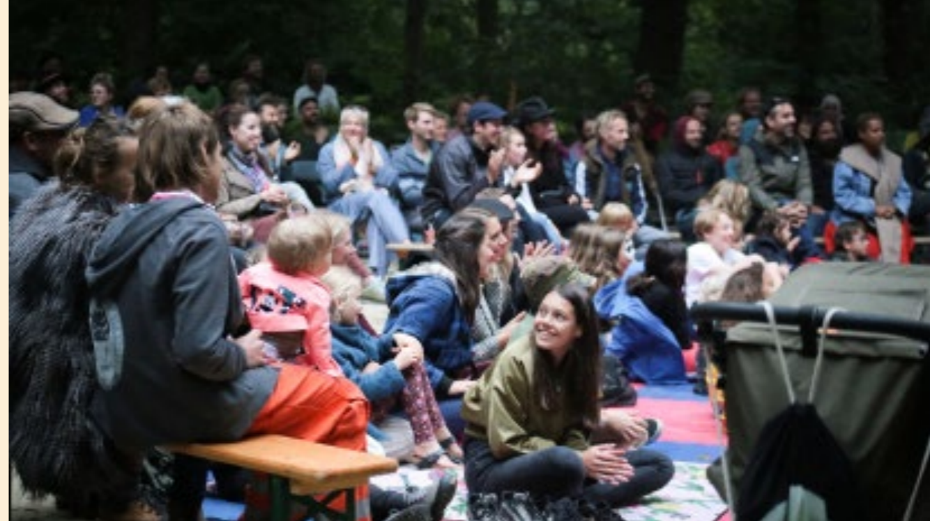
PAGINA 16 | CIRCUSBENDE 2022