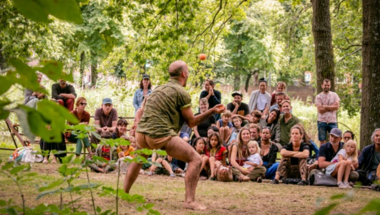
PAGINA 15 | CIRCUSBENDE 2022